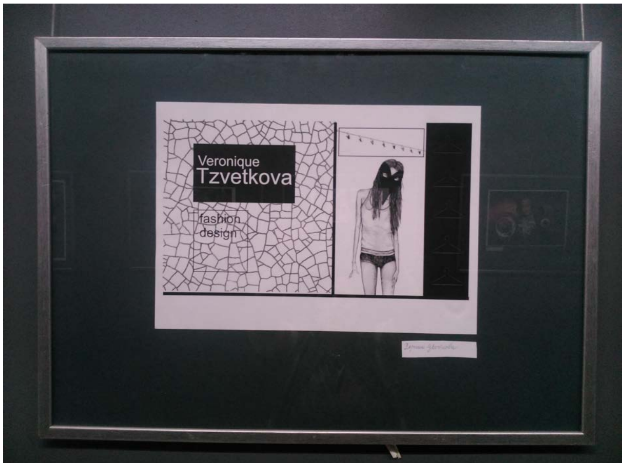
Вероник Цветкова – първи курс БП „Мода”